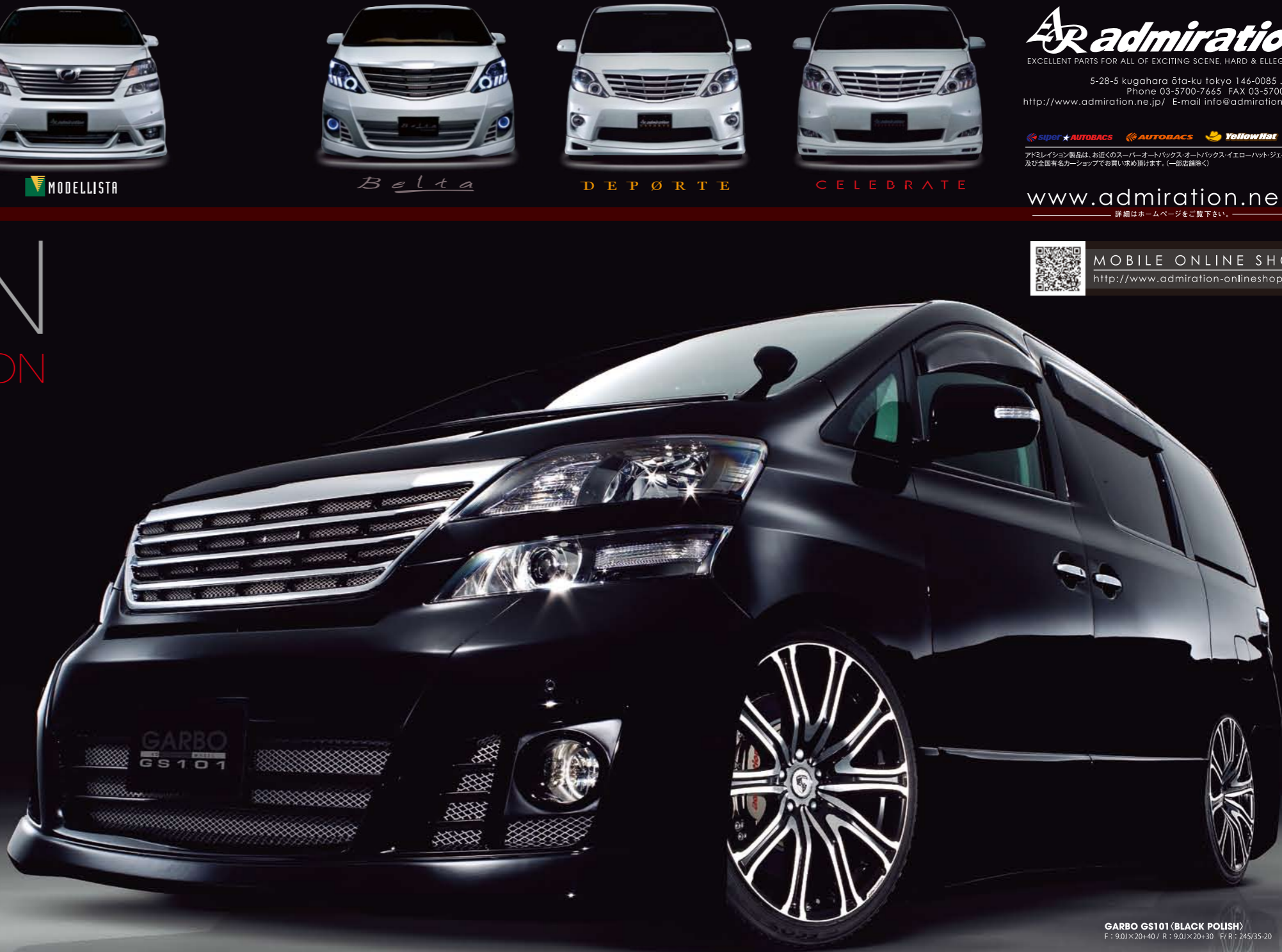
GARBO GS101 (BLACK POLISH) F: 9.0J×20+40 / R: 9.0J×20+30 F/R: 245/35-20

期間限定キャンペーン 2009.12/31までにご成約の方に限り レッドセンターキャッププレゼント!!