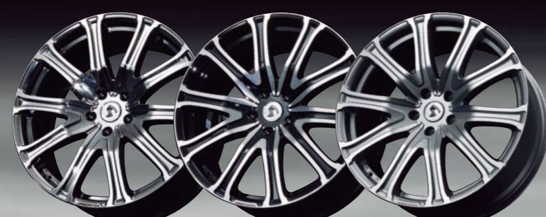
SBC BLACK POLISH SILVER POLISH

すべてのスタイリングパーツが車種別に用意されるように すべてのインテリアパーツがそのクルマのためだけにプランニングされるように admirationではホイールもまたターゲットを極限まで絞りました。 それがadmiration-GARBOです。 私たちの既存のホイールブランドAmistadの各モデルは すべてのハイエンドカーの足元を機能美で飾る最高級ランクのホイールですが admiration-GARBO GS101は、業界の常識をくつがえし まずはアルファード/ヴェルファイアをクローズアップします。 個性的で表情豊かな10本スポークと ワンピースのメリットを最大限に活かした伸びやかなルックス。 admiration-GARBO GS101のファーストエディションは アルファード/ヴェルファイアのためだけに美しい足元を演出します。 そして、ご好評をいただいているadmirationのエアロ インテリアとのワンブランドコーディネートも可能にします。