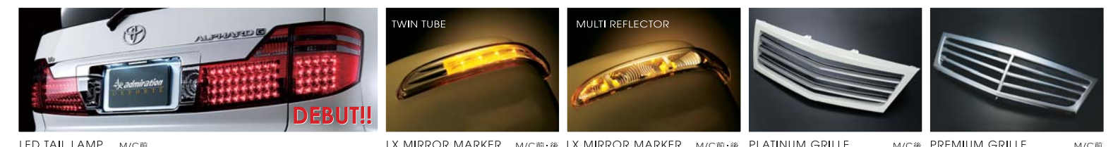
LED TAIL LAMP M/C前 LX MIRROR MARKER M/C前・後 LX MIRROR MARKER M/C前・後 PLATINUM GRILLE M/C後 PREMIUM GRILLE M/C前

AR admiration アドミレイション 【表示価格はメーカー希望小売価格につき税別】 【※1】 装着時 純正バンパー及び純正マフラー要加工 【※2】 塗装済：左右ダクト枠 (プレミアムシルバー) 【※3】 プラインドモニター付車種 ¥2,000 UP 2006～2007年版 総合カタログ 請求券 STYLE WAGON 12.16